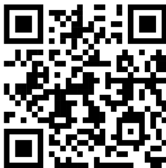
รายงานการอนุญาตสร้างวัด